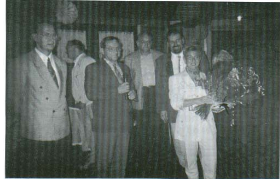
.... Der Vorstand beim 1000sten Mieter ....

langfristig - möglichst verbindlich - angemeldet werden. Am 28. August 1996 konnte der Vereinsvorstand den 1.000sten Mieter in Anwesenheit der Presse willkommen heißen.