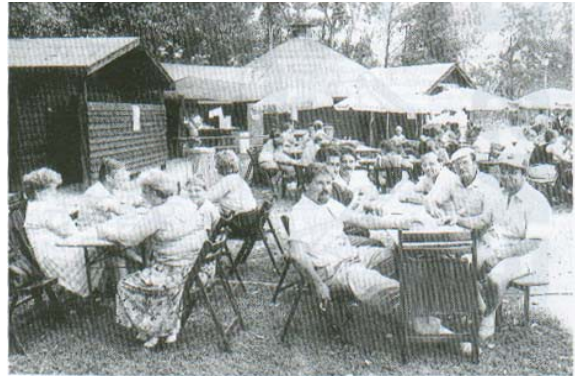
Vergnügter Stimmung herrschte beim zünftigen Grillhütten-Fest an der Grillhütte Echtzer See am vergangenen Wochenende. Rechts im Bild das Vorstandsteam des heute 55 Mitglieder umfassenden Bauvereins „Grillhütte Echtzer See“.

zweckmäßigen Küche und ist mit Geschirr in verschiedenen Ausführungen ausgestattet, damit neben zünftigen Grillabenden auch dekorative Festtafeln für die bedeutendsten Feste im Leben arrangiert werden können.